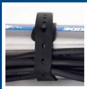
Jednoduchá manipulácia s vodičmi s fixačným popruhom.