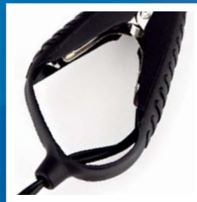
Špeciálne navrhnuté svorky udržujú vodiče na mieste a uľahčujú manipuláciu.