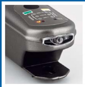
Praktické svetlo na prednej strane uľahčuje prácu za tmy.

Nabíjačky EXIDE zaistia optimálne nabitie batérií od 1Ah až do 300 Ah. Majú integrované svetlo pre použitie za tmy, špeciálne navrhnuté svorky pre optimálne nabíjanie a kábel, ktorý sa elegantne vinie okolo nabíjačky, pre jednoduché použitie. Naše nabíjačky majú všetky vlastnosti, o ktorých vieme, že ich hľadajú naši zákazníci. Rozumieme batériám. Teraz je tu nabíjačka, ktorá to dokáže využiť.