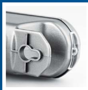
Môže byť zavesená alebo upevnená na stenu.