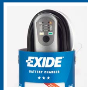
Praktický obal pre bezpečné uloženie.