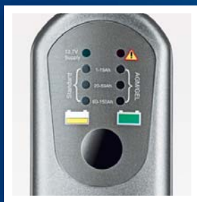
Jednoduché použitie - jedno tlačidlo na všetko.

Pravidelné dobíjanie udržuje vašu batériu pripravenú pre okamžité použitie, môžete sa tak spoľahnúť, že vám dodá energiu, ktorú práve potrebujete. Správna starostlivosť o akumulátor predlžuje aj jeho životnosť.