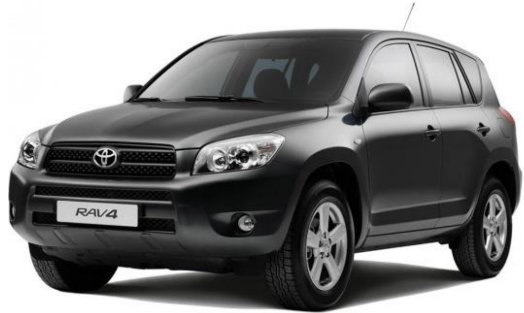
Kryt 1.0608.00 Toyota Rav-4 LWB dlouhá verze